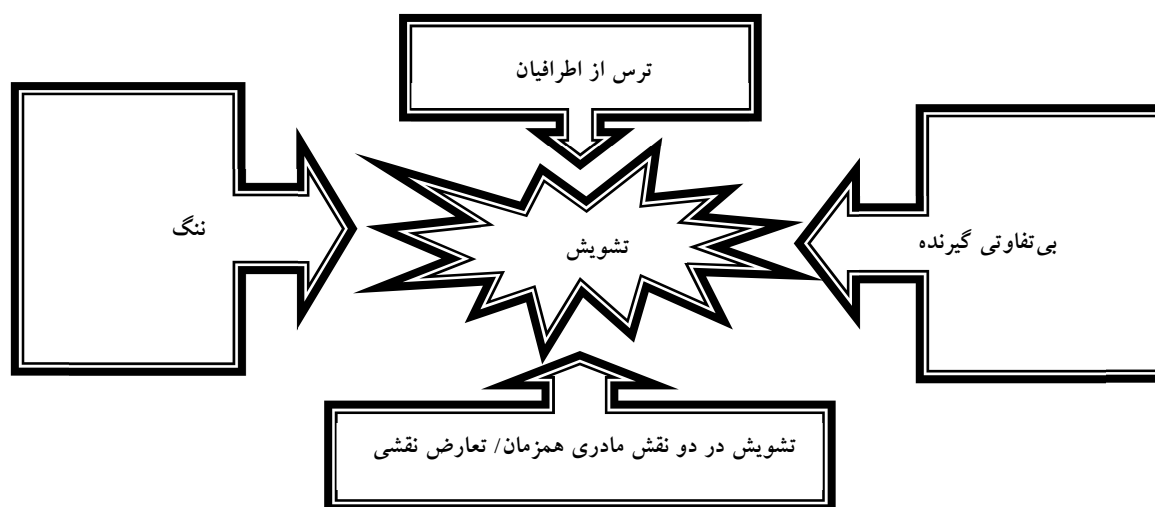
شکل ۲. چگونگی شکل گرفتن درون‌مایه تشویش

و جنین حاصل از آن‌ها به رحم مادر جایگزین انتقال می‌یابد. گروهی از فقهای معاصر این روش را نامشروع دانسته‌اند. مانند آیت‌الله فاضل لنکرانی که بیان نمودند: "جنین حاصل از نطفه غیر زوج جایز نیست". البته آیات عظام خامنه‌ای و مکارم شیرازی عمل مزبور را در صورت اجتناب از حرام، فاقد منع شرعی می‌دانند (۱۶). از نظر حقوقی نیز با توجه به قانون نحوه اهدای جنین به زوج‌های نابارور مصوب ۱۳۸۲/۵/۸، انتقال جنین‌های اهدایی که توسط زوج‌های بارور در محیط آزمایشگاهی لقاح یافته‌اند، در رحم زوجه ناباروری که وی یا همسرش و یا هر دو دارای مشکل نازایی هستند، منع قانونی نخواهد داشت (۱۷). در مطالعه آرامش، تجربه این زنان از مسایل اخلاقی بررسی شده است که بیان می‌کند فقهای اهل تسنن رحم اجاره‌ای را نپذیرفته‌اند و اهل تشیع هم تنها برای زوج‌های قانونی و تحت شرایط مشخصی آن را قبول دارند (۱۸). در روش اجاره رحم با تخمک اهدایی نیز می‌توان دو فرض را تصور نمود. در فرضی که تخمک اهدایی از زن ثالث است و یا آن که تخمک اهدایی مادر جایگزین می‌باشد که البته در هر دو فرض تخمک زنان بیگانه است که با اسپرم پدر حکمی که با آن‌ها رابطه‌ای ندارد، در محیط آزمایشگاه لقاح یافته و به رحم مادر جایگزین انتقال می‌یابد (۱۸). در این خصوص بنا به نظر فقها به مانند آیت‌الله مکارم شیرازی و آیت‌الله صافی گلپایگانی ایشان قایل به وجوب احتیاط هستند